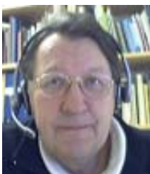
Ramqvist InterNet- föreläser