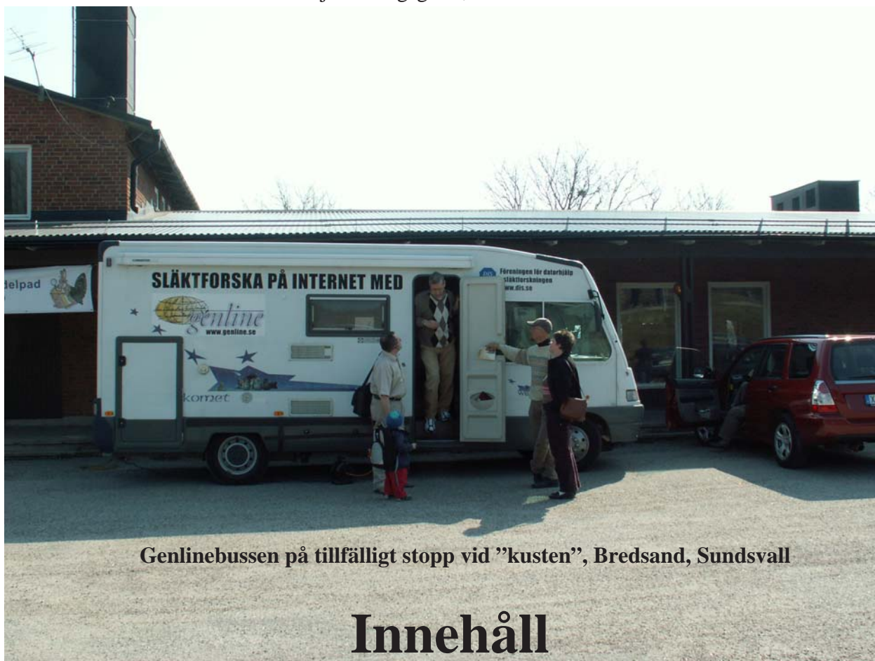
Genlinebussen på tillfälligt stopp vid "kusten", Bredsand, Sundsvall