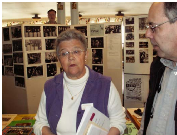
Wivex, Musiklivet i Sundsvall