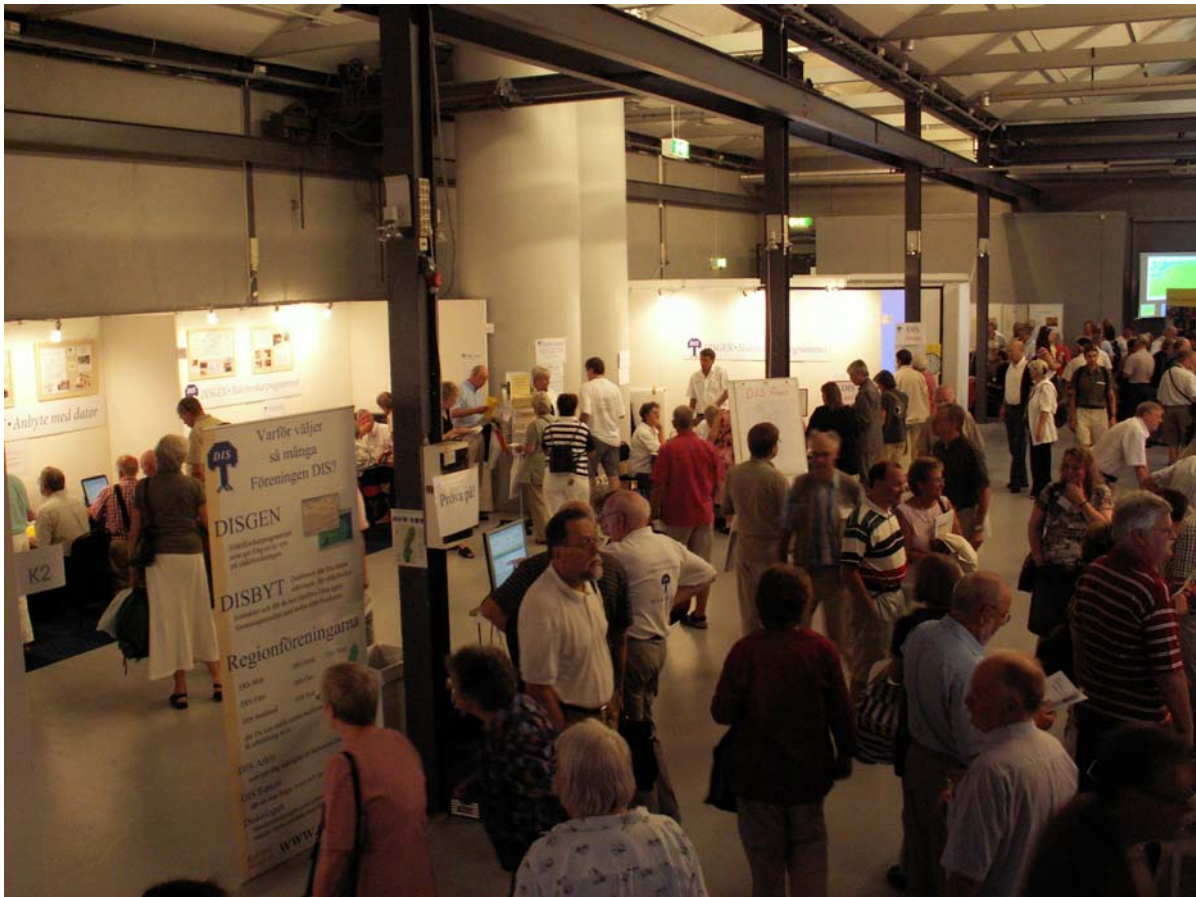
Vy över rummet som DIS disponerade under släktforskardagarna