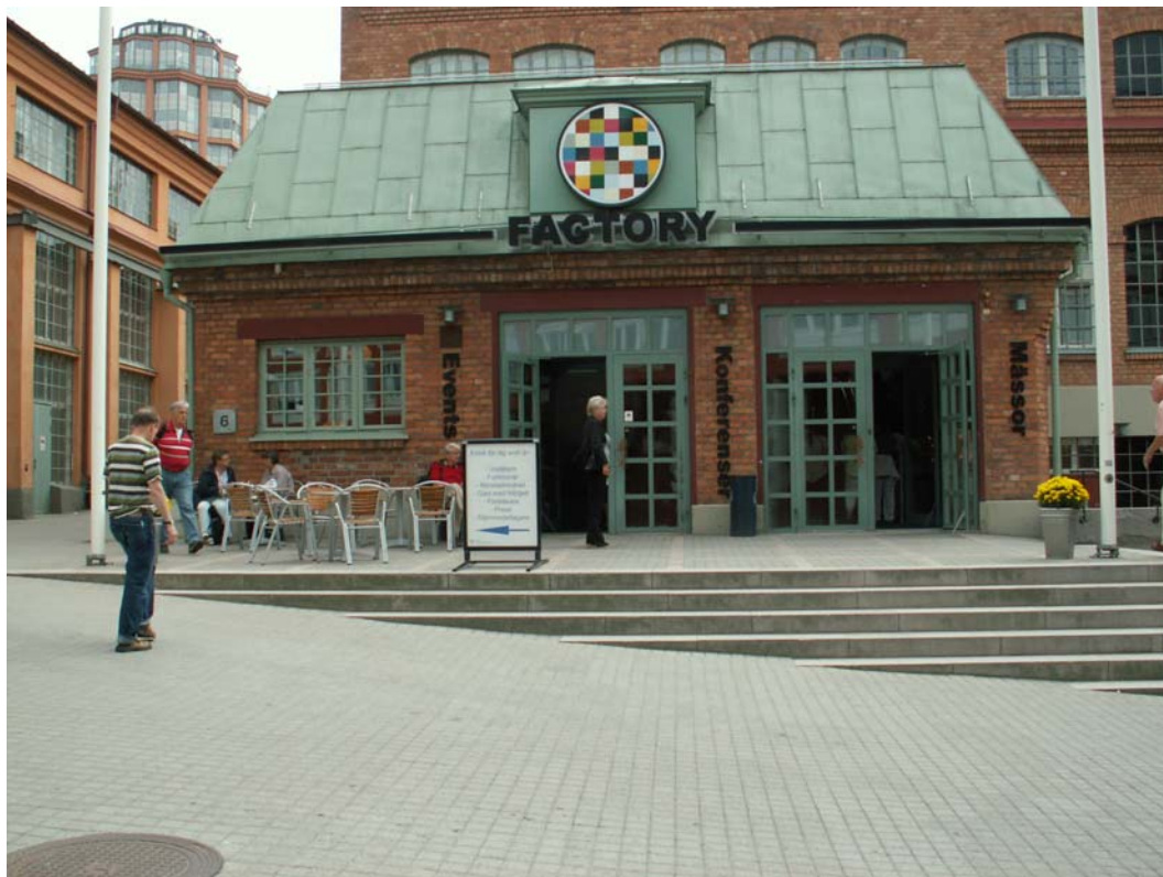
Factory, Nacka strand, Stockholm