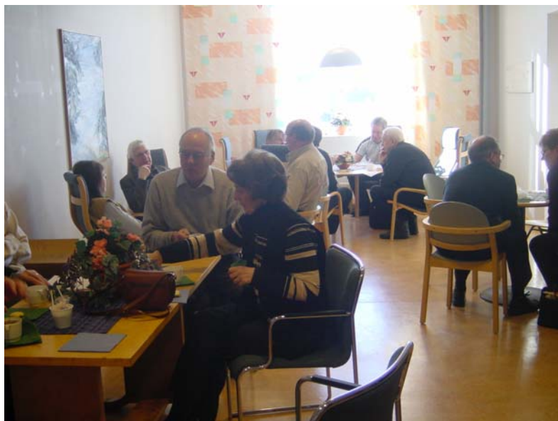
Fika efter årsmötesförhandlingarna.